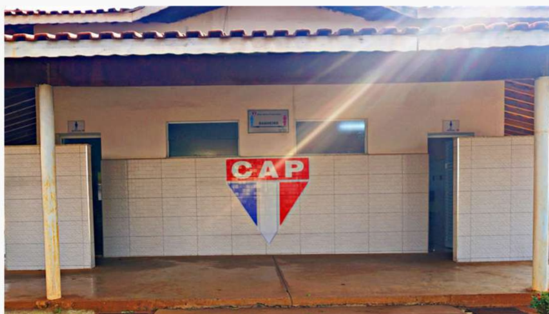
Fachada Entrada dos Sanitários hoje em dia.