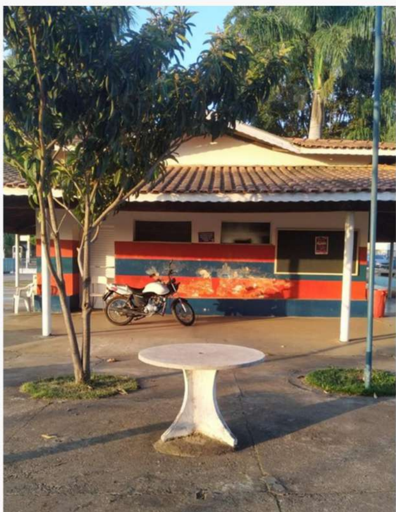
Fachada Entrada dos Sanitários Antes.

Confira alguns Antes x Depois das obras do CAP: