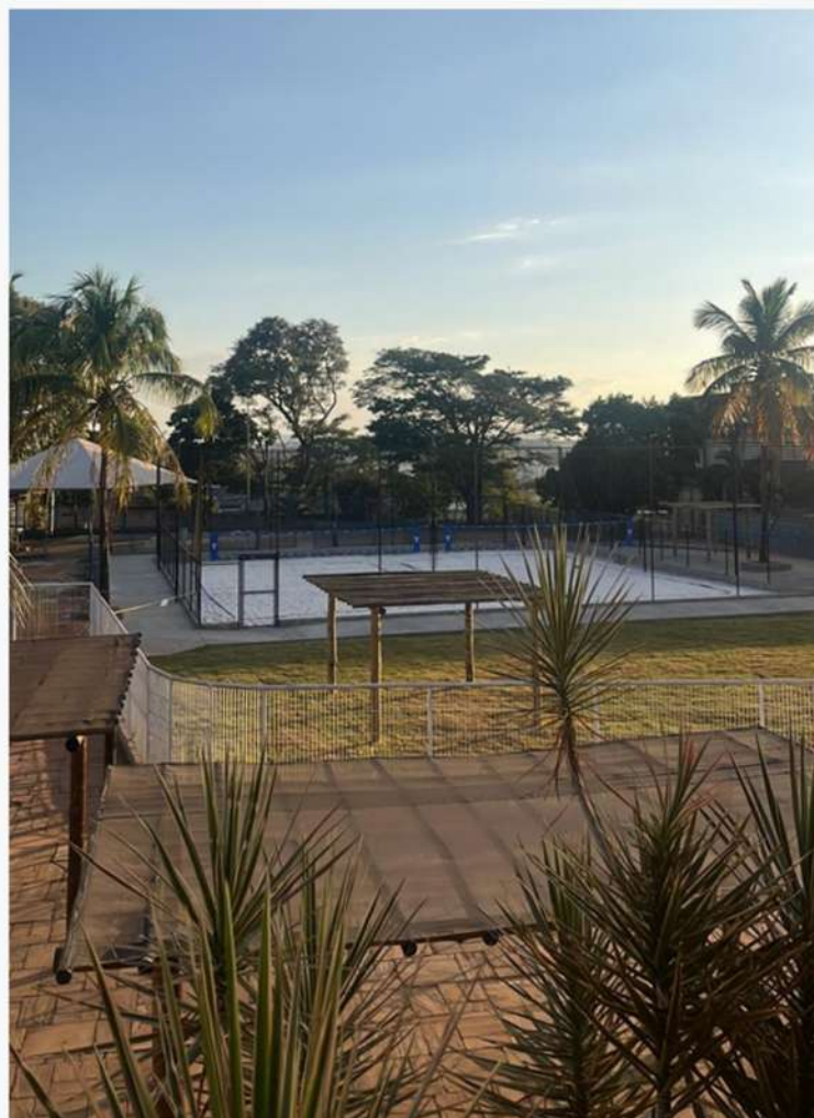
Área das Quadras de Areia hoje em dia.