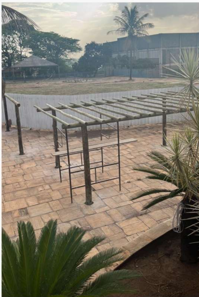
Área das Quadras de Areia antes.

Confira alguns Antes x Depois das obras do CAP: